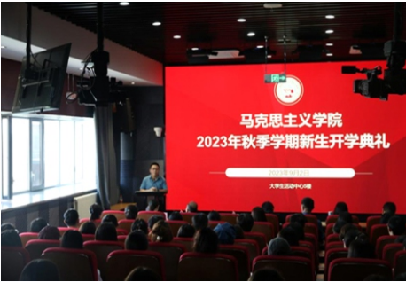
马克思主义学院新生开学典礼