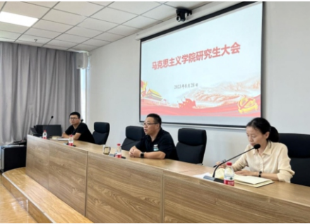
马克思主义学院新学期研究生大会