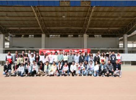
“运动青春、欢乐校园”趣味运动会