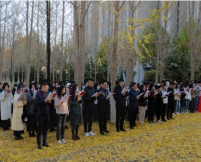
“银杏林”马列经典诵读活动

专业代码、名称及研究方向： 030500马克思主义理论（不区分研究方向） 初试科目： 101思想政治理论 201英语（一） 764马克思主义基本原理 859马克思主义中国化（含中共党史） 同等学力加试： (1)马克思主义哲学史 (2)中国近现代史 初试科目参考书目： 《马克思主义基本原理》，本书编写组，马克思主义理论研究和建设工程重点教材，高等教育出版社，2023年版； 《习近平新时代中国特色社会主义思想概论》，本书编写组，马克思主义理论研究和建设工程重点教材，高等教育出版社、人民出版社，2023年版。 《中国共产党简史》，本书编写组，人民出版社、中共党史出版社，2021年版。 同等学力加试科目参考书目： 《马克思主义哲学史》，本书编写组，马工程教材，高等教育出版社、人民出版社，2012年版。 《中国近现代史纲要》，本书编写组，马工程教材，高等教育出版社， 2023 年版。